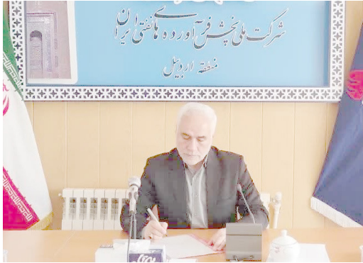
مدیر شرکت ملی پخش فرآورده های نفتی منطقه اردبیل از جایگزینی بیش از ۲۵ درصدی مصرف سوخت سی ان جی با بنزین موتور در منطقه اردبیل خبر داد.