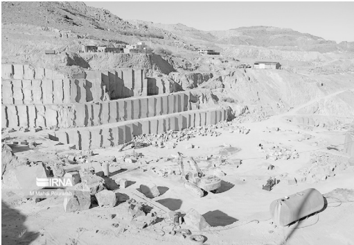
وی تأکید کرد: انسجام در تصمیم‌گیری، یکپارچگی و هماهنگی میان شرکت‌ها و بخش معدن کشور، اصول اولیه این طرح باشد به گونه‌ای که بتوان ضمن همکاری با شرکت‌های خارجی در تأمین این ماشین‌آلات، زمان‌بندی مناسبی برای اجرای برنامه تهیه شود.