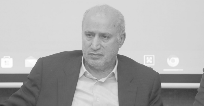
مجزور را بگیرند.

رئیس فدراسیون فوتبال تاکید کرد: از لحاظ مادی لیگ را برگزار کردیم اما درآمدهای روز مسابقه محروم هستیم. عمده درآمدهای باشگاه‌ها از روز مسابقه، اسپانسر، حق پخش، پیراهن و دور زمین است. از بسیاری از این درآمدها محروم هستیم زیرا نه باشگاه ورزشگاه دارد و نه