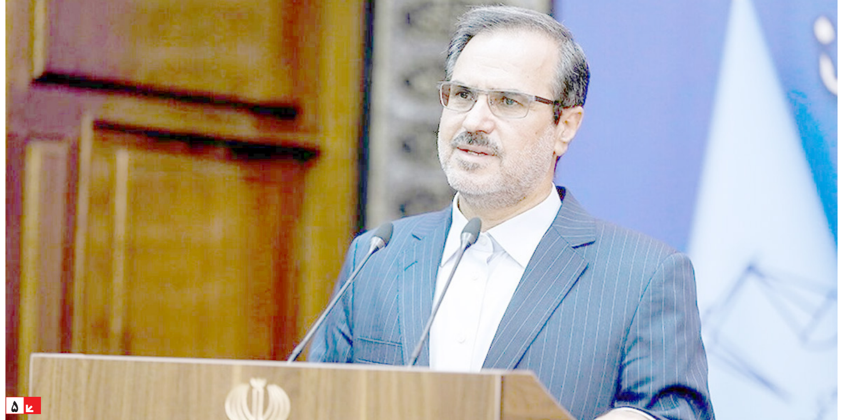
رئیس سازمان بازرسی کل کشور: برخی دستگاه‌ها دوست ندارند املاکشان شفاف شود